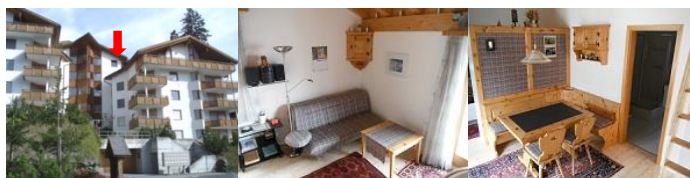
Ansicht der Casa Cresta von der Prätschlistrasse