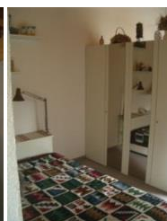
Schlafcke mit Kleiderschrank