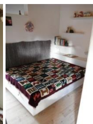
Bett mit Ablagen