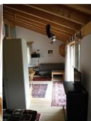
Übersicht Studio (Balkon ist rechts)