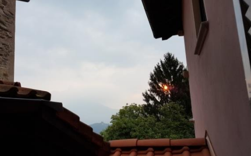
Morgendliche Aussicht vom Kinderzimmer