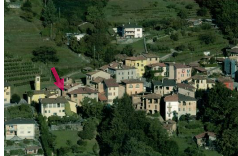
Cimo, Dorfkern vor 40 Jahren

Mit Zug ab Bahnhof Lugano mit der Bahn nach Ponte Tresa bis Agno, dann mit Postauto Richtung Aranno/Cademario bis nach «Cimo Paese».