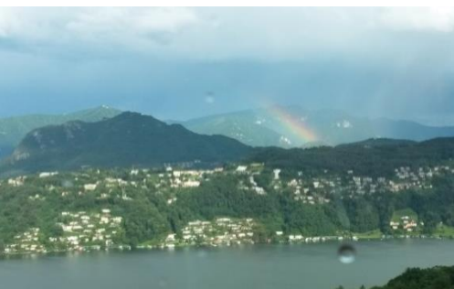
Sicht von Vernate auf San Salvatore und Generoso