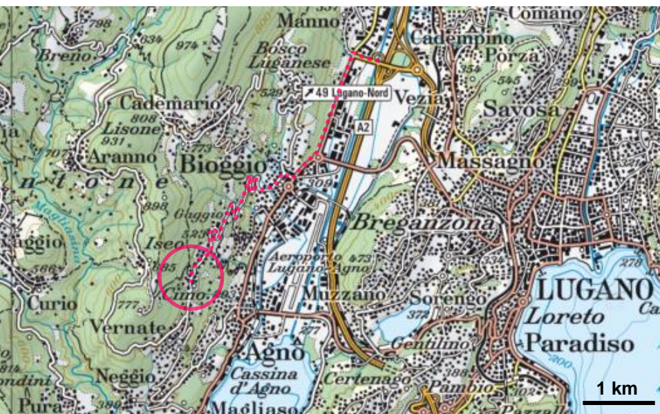
Karten mit Lizenz: geo.admin.ch / Swisstopo Fotos: Cyril Alther, Matthias Bürgisser, Gabriella Meier

Bestellen Sie unverbindlich eine Offerte für den gewünschten Zeitraum.